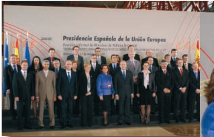
El Presidente de la FEMP participó en Málaga en la reunión informal de Ministros de Política Territorial.

La Cumbre Europea de Gobiernos Locales, celebrada en Barcelona, y el II Foro de Gobiernos Locales de la UE, América Latina y el Caribe, que tuvo lugar en Vitoria, fueron dos de los Encuentros más relevantes organizados por la FEMP en el marco del Plan de Acción