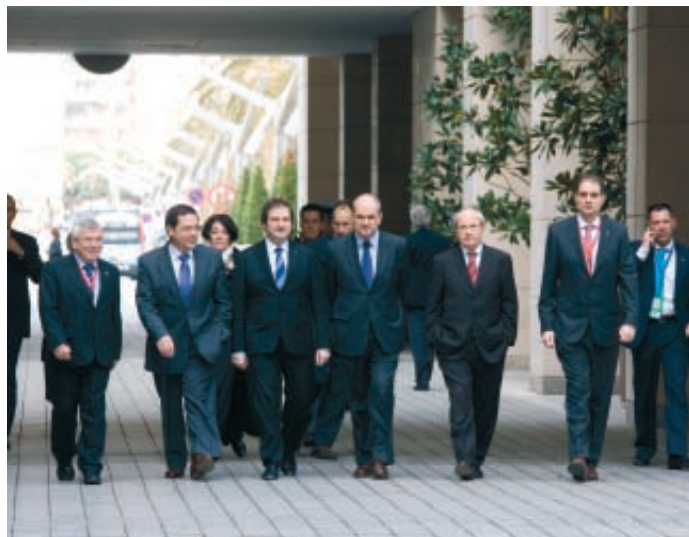
Autoridades europeas, nacionales, regionales y locales participaron en la Cumbre Europea de Gobiernos Locales, celebrada en Barcelona.

La puesta en marcha y difusión del citado texto se hizo en el marco del Plan de Acción suscrito entre la FEMP y la Secretaría de Estado para la Unión Europea, en el que también se preveía la organización y respaldo a diversos encuentros y jornadas.