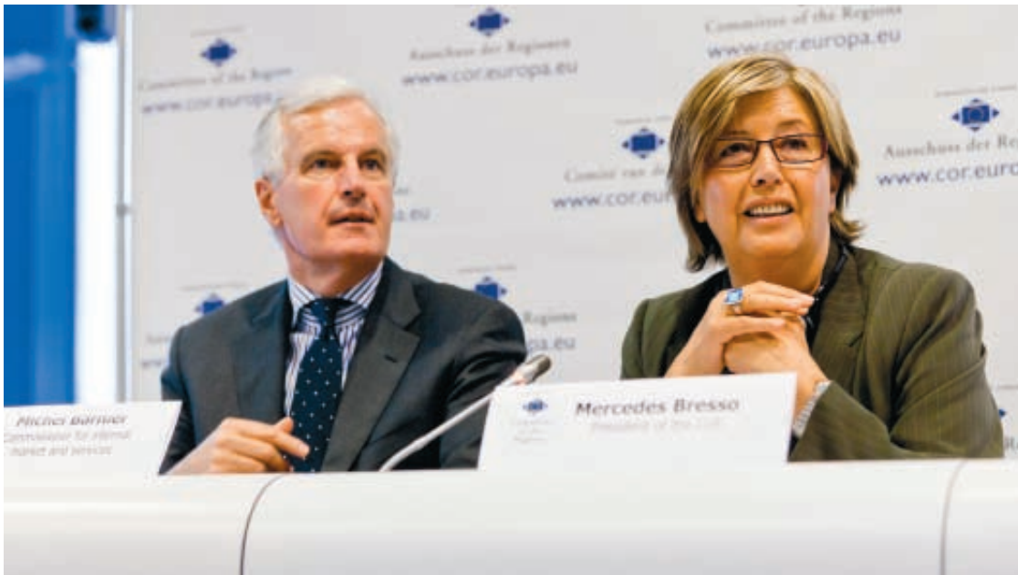
El Comisario Barnier junto a la Presidenta del Comité, Mercedes Bresso.

El Comité de las Regiones se opone firmemente a suspender el Fondo de Cohesión para sancionar a Estados miembros que sean objeto de un procedimiento por contraer déficits excesivos”, tal y como propone la Comisión: si bien, apoya el principio de solidaridad europea y el refuerzo de la disciplina presupuestaria que está recomendando.