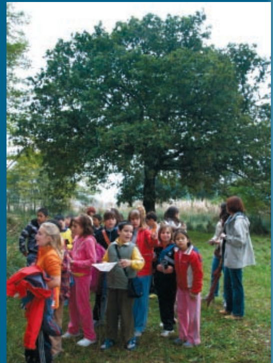
Escolares del Colegio Juan de Herrera junto al roble centenario del 'Montezuco', que fue investigado para hacer el proyecto premiado.

El segundo premio de esta última categoría fue para el proyecto "Más Bio Más Vida", que recoge de manera muy gráfica el trabajo de sensibilización hacia la Biodiversidad en ese barrio de la ciudad. A través de unas pequeñas macetas de flores de colores, tanto los alumnos como los vecinos del barrio han ido formando la palabra "Biodiversidad". En la revista, los propios alumnos han explicado su relación con la Biodiversidad, expresando las diferencias que existen entre sus lugares de origen.