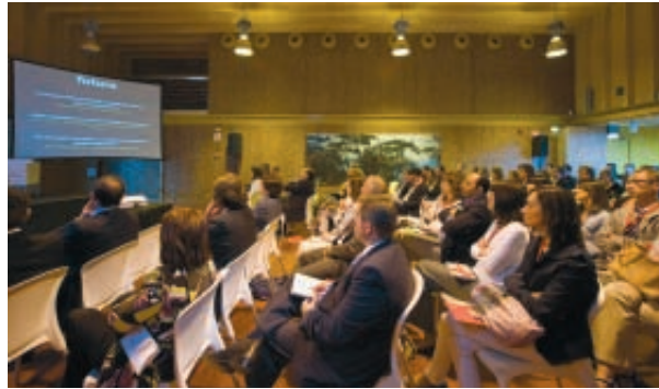
Desarrollo del Foro MICE, que congregó a más de 200 participantes.

Los pasados días 16, 17 y 18 de junio, Zaragoza acogió la celebración del I Foro MICE (Meeting, Incentives, Congress and Exhibitions) y de la Asamblea anual del SCB (Spain Convention Bureau), dos eventos que congregaron a numerosos expertos y que convirtieron a la ciudad aragonesa en la capital del turismo de reuniones durante varias jornadas.