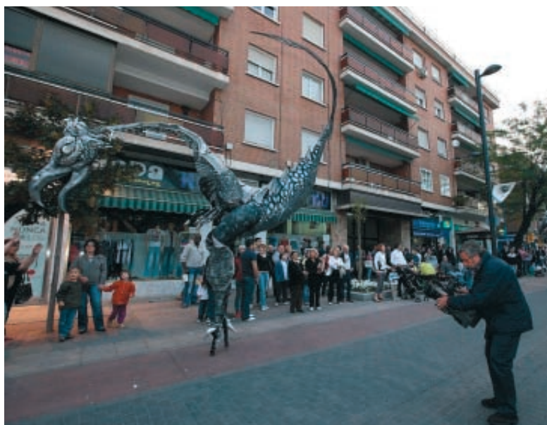
La ciudad de Getafe vivió el encuentro y participó de las actividades paralelas que llenaron sus calles y plazas.

Ante las desigualdades que existen entre las periferias de las diversas zonas del mundo y países, el FALP pide que se garantice el acceso de las poblaciones "con condiciones de vida modestas" a todos los servicios de la metrópolis.