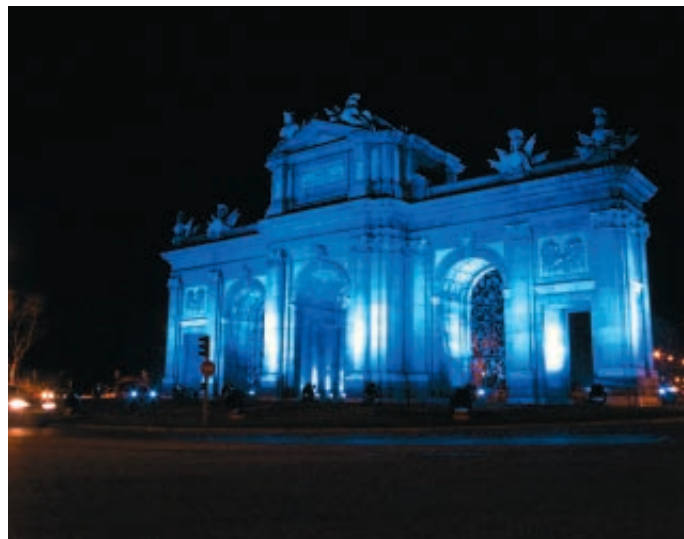
Los municipios visitieron de azul sus edificios más emblemáticos para recibir el semestre.

La Cumbre de Barcelona, en la que participó el Presidente de la FEMP, Pedro Castro, analizó también otras cuestiones, como el papel de los Entes Locales intermedios, el futuro funcionamiento del Consejo de Municipios y Regiones de Europa (CMRE) y el papel de los Alcaldes en la construcción europea; de hecho, la