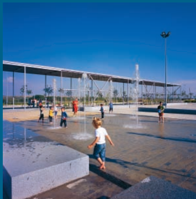
Barrio de San Juan, Zuera (Zaragoza).