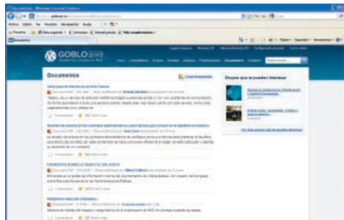
El elevado número de documentos incorporados está convirtiendo GOBLOnet en un repositorio documental muy relevante.

Entre los proyectos a corto plazo, destaca la incorporación de herramientas para realizar votaciones mediante DNI electrónico, gestionar inscripciones en eventos o subir imágenes y vídeos desde el equipo del propio usuario ★