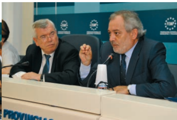
El Consejo Federal ratificó los acuerdos de la Ejecutiva.