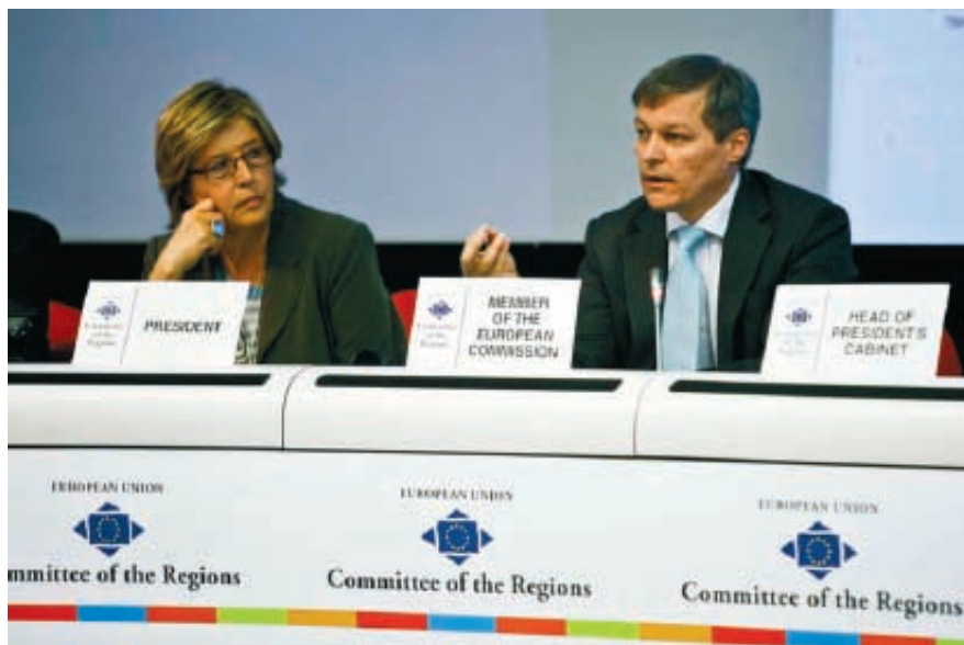
El Comisario de Agricultura de la UE, Dacian Ciolos, y Mercedes Bresso.

En Bruselas también se debatió sobre la mejor manera de poner en práctica la “iniciativa ciudadana”, establecida por el Tratado de Lisboa, como una nueva forma de participación en la elaboración de políticas de la UE; esta iniciativa prevé que un grupo de al menos un millón de ciudadanos de la UE, que sean nacionales de un número significativo de Estados miembros, podrá pedir a la Comisión Europea la presentación de una propuesta legislativa. El Comité ha mostrado su respaldo a esta iniciativa, ya que se trata de un paso adelante hacia la democracia participativa a escala europea, aunque ha pedido que se suavicen los requisitos impuestos a los ciudadanos europeos para presentar una iniciativa ciudadana.