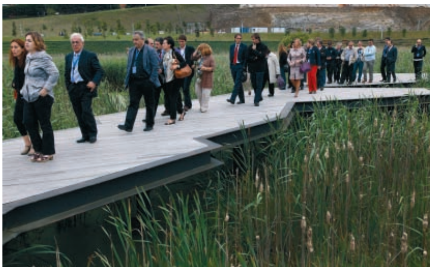
Santander acogió las Jornadas y la Asamblea de la Red Española de Ciudades por el Clima.

Del mismo modo, afirmó que la Red Española de Ciudades por el Clima ha sido y debe seguir siendo un referente para el Gobierno español de cara a las negociaciones con otros países en materia de cambio climático y que por ello, tratarán de estar presentes en la próxima cumbre del clima que se celebrará en Méjico. Abel Caballero recordó que España es el único país que acudió con los Ayuntamientos a la cumbre de Copenhague.