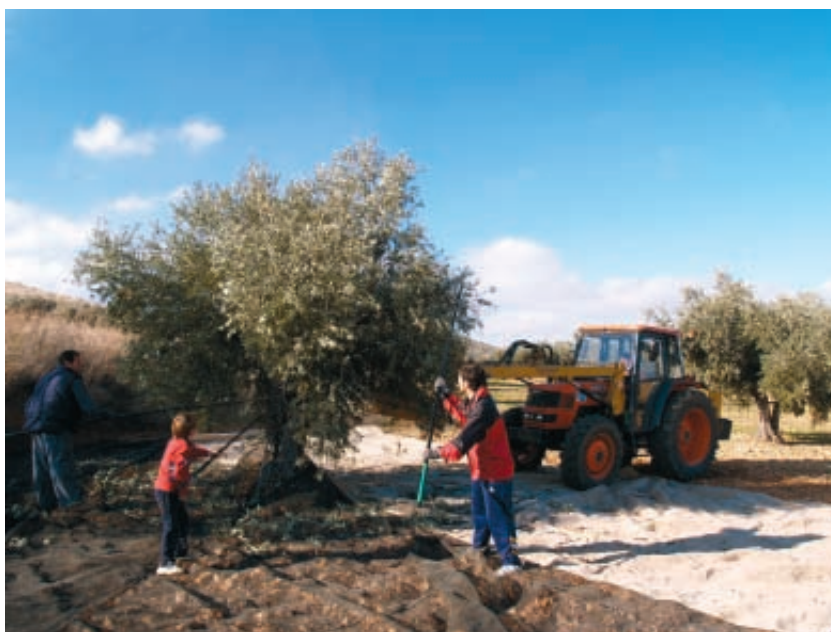
La FEMP firmará el convenio para coordinar los flujos migratorios con motivo de las campañas agrícolas de temporada.

de su estructura directiva y una serie de instrucciones para racionalizar los gastos en el funcionamiento de la organización y algunas de las actividades que desarrolla.