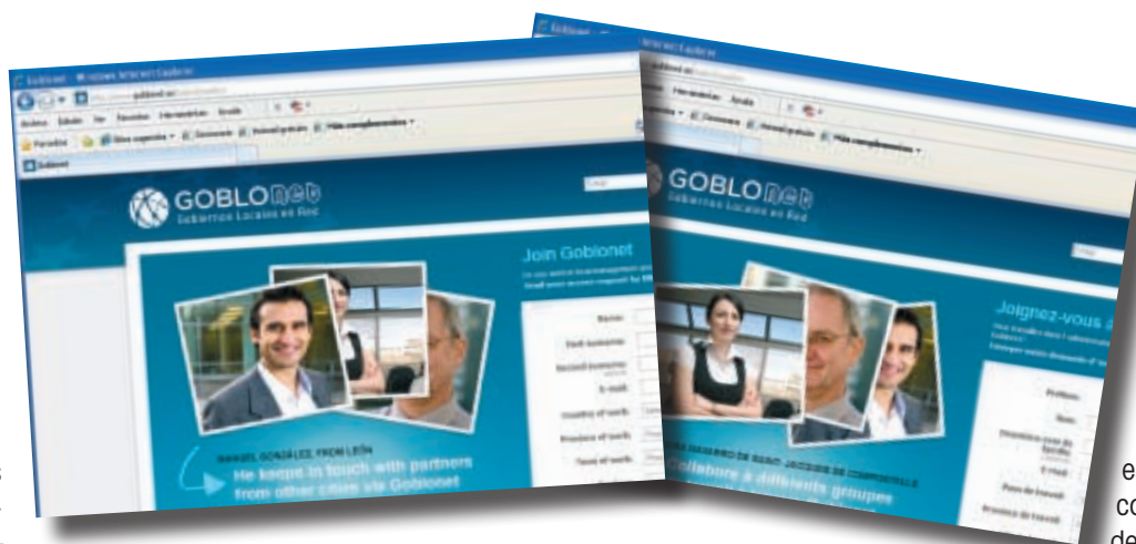
GOBLOnet ya está disponible en inglés y francés, y muy pronto lo estará también en alemán.

Apenas un mes después de su puesta en marcha, GOBLOnet, la red social impulsada por la FEMP, ya se ha consolidado como herramienta de trabajo entre técnicos y electos locales y expertos en Administración Local. En este tiempo ya ha recibido 20.550 visitas, se han visitado 176.522 páginas y más de 3.000 personas han dado de alta un perfil en esta red social de Gobiernos Locales.