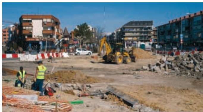
Los Gobiernos Locales apuestan por la rehabilitación y el reciclaje urbano como principal instrumento de transformación de la ciudad.

Por último, hay que diseñar con criterios bioclimáticos, una exigencia que ya se está produciendo tanto en el ámbito nacional, como en el autonómico e, incluso, en el local. El Diseño Bioclimático no debería ser exclusivo de los edificios, sino que habría de alcanzar a los espacios urbanos, en el diseño de aceras, plazas o zonas verdes ★